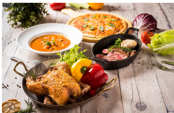
四人分享餐 Set Menu for Four