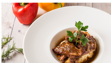
慢燉牛肋排搭波特紅酒醬 (300g) Slow Stewed U.S. Beef Rib with Port Wine Sauce