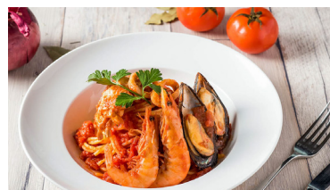
馬賽風乾番茄海鮮義大利麵 Fishman Style Tomato Seafood Stewed with Spaghetti