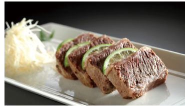
清燉陳皮無骨牛 Stewed Beef with Preserved Citrus