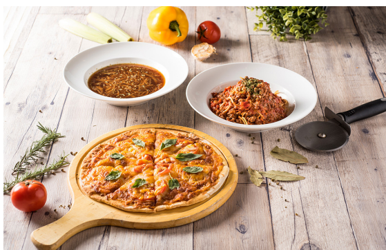
兩人分享餐 Set Menu for Two