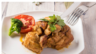
坦督里烤雞 (360g) Tandoori Chicken