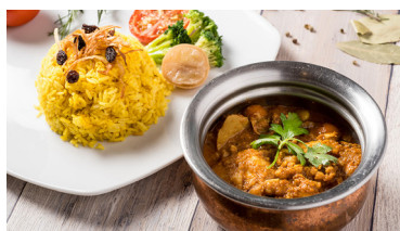
印度雞肉咖喱 Indian Chicken Curry