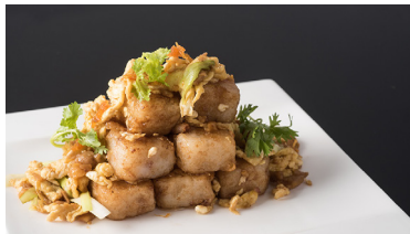
潮式炒蘿蔔糕 Wok-fried Turnip Cake with Eggs, Chives, Dried Radish and Chili Sauce