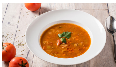
和牛蕃茄蔬菜湯 Wagyu Tomato Vegetable Soup