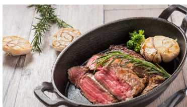
奶油熟成牛排 (300g) Butter Dry-aged Steak