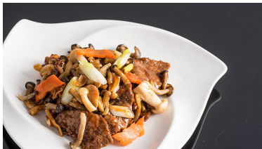
茶菇靚牛肉 Wok-fried Beef Slices with Mushroom