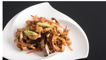
粵亮招牌小炒皇 Wok-fried Pork with Dried Radish, Dried Tofu, Garlic and Chili