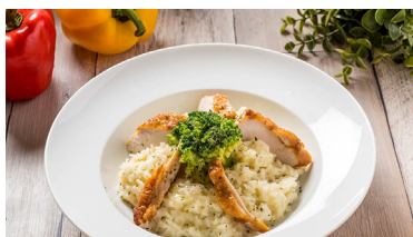
嫩雞胸紹興奶油燉飯 Risotto with Chicken Breast and Shaoxing Butter