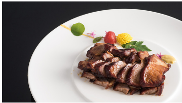
經典黑叉燒 Maltose Barbecue Pork