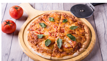
手擀薄皮瑪格莉特披薩 (8吋) Margherita Pizza