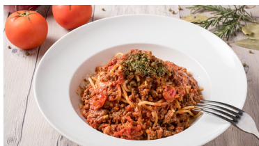
和牛肉醬義大利麵 Wagyu Pasta