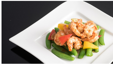
蝦球 Wok-fried Shrimps