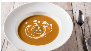
龍蝦湯 Lobster Soup